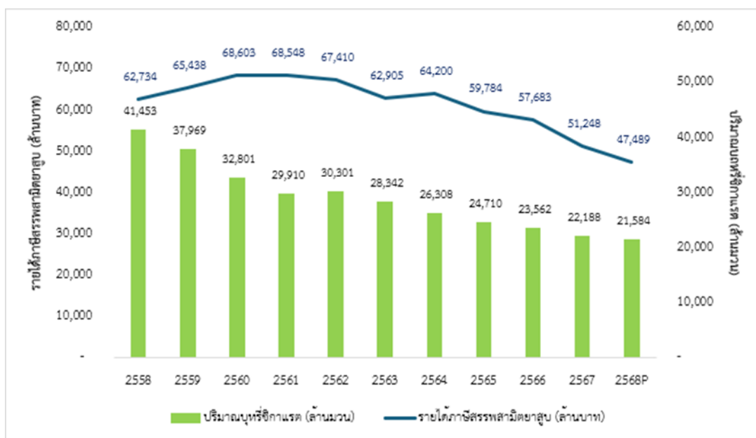
รูปที่ 3 อุปทานบุหรี่ปิดกฎหมายที่เสียภาษีสรรพสามิตและรายได้สรรพสามิตยาสูบระหว่าง ปี 2558-2568

รายได้ภาษีสรรพสามิตยาสูบที่รัฐจัดเก็บได้ลดลงอย่างต่อเนื่องนับตั้งแต่การปรับโครงสร้างภาษีสรรพสามิตยาสูบในปี 2560 โดยในปีดังกล่าวรัฐจัดเก็บภาษีสรรพสามิตยาสูบได้ทั้งสิ้น 68,603 ล้านบาท จากปริมาณบุหรี่ที่ผลิตและนำเข้ารวม 32,801 ล้านมวน แต่ในปี 2568 รายได้ภาษีสรรพสามิตยาสูบลดลงเหลือเพียง 47,489 ล้านบาท หรือคิดเป็นการลดลงของรายได้ภาษีสรรพสามิตยาสูบร้อยละ 7 เมื่อเทียบกับปีก่อนหน้า ปรากฏตามรูปที่ 3 สวนทางกับการเติบโตของบุหรี่ปิดกฎหมายจากร้อยละ 6.6 ในปี 2560 เป็นร้อยละ 28.1 ในปี 2568 ทั้งนี้ พบว่าการเติบโตของบุหรี่ปิดกฎหมายยังสร้างความสูญเสียในการจัดเก็บรายได้ภาษีสรรพสามิตกว่า ปีละ 20,000 ล้านบาท และภาษีอื่น ๆ ที่เกี่ยวข้องกว่า 6,000 ล้านบาท/ปี รวมเป็นความสูญเสียทางภาษีมากกว่าปีละ 26,000 ล้านบาท 20 ดังนั้น มูลค่ารวมของความเสียหายต่อรัฐและอุตสาหกรรมยาสูบโดยรวมจากกิจกรรมการค้าบุหรี่ปิดกฎหมายในปี 2568 จึงมีปริมาณไม่น้อยกว่า 31,000 ล้านบาท